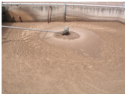
Рис. 3. Перед использованием BioRemove™ 3200.

ПРИМЕР: Пищевое производство испытывало связанное с жиром вспенивание в аэротенке. Толстая жирная пена покрывала 70-80% поверхности аэротенка, что приводило к дополнительным затратам (высокой стоимости) на пеногаситель, для урегулирования проблем во вторичном отстойнике. Специалисты Новозаймс, оценив ситуацию, пришли к заключению, что микробное сообщество неспособно самостоятельно справиться с нагрузкой жира. Производство начало программу с BioRemove 3200, который был разработан, для увеличения способности микробного сообщества деградировать жир. В пределах одного возраста активного ила, BioRemove 3200 деградировал жир таким образом, что только 10-15 % площади поверхности осталось покрыто пеной. Благодаря продолжающемуся регулярному внесению биопрепарата - повысилась эффективность деградации жира, колония микроорганизмов улучшилась настолько, что необходимость в пеногасителе была ликвидирована.