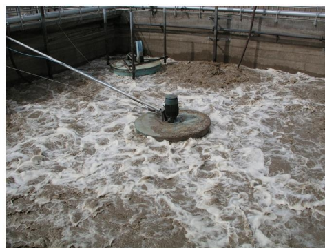
Рис. 4. С использованием BioRemove™ 3200.